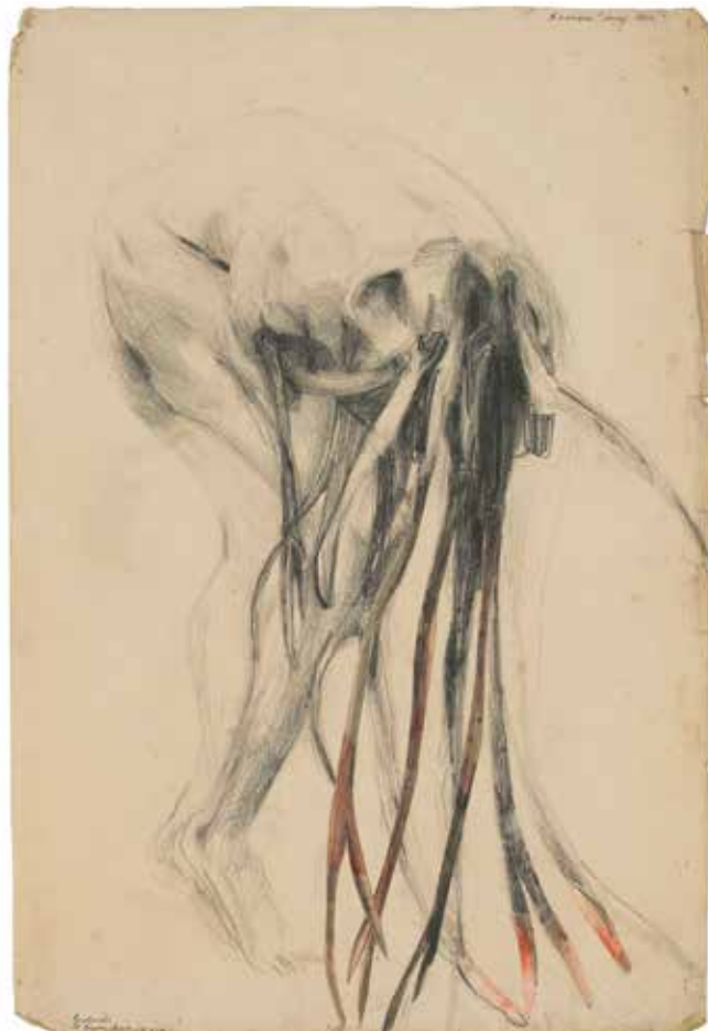
Berlinde De Bruyckere | Romeu my deer, 2010 - 2011 | Private Collection. Courtesy Hauser & Wirth