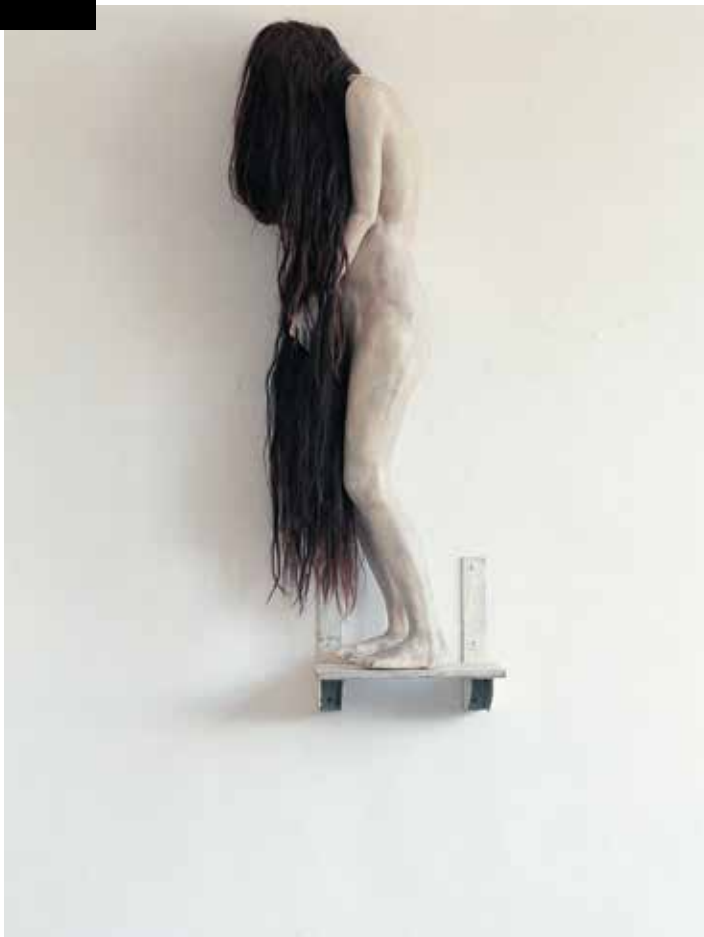
Berlinde De Bruyckere | Hanne, 2003 | Hauser & Wirth Collection, Switzerland