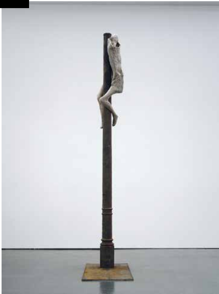
Berlinde De Bruyckere | Schmerzensmann I, 2006 | David Roberts Collection, London