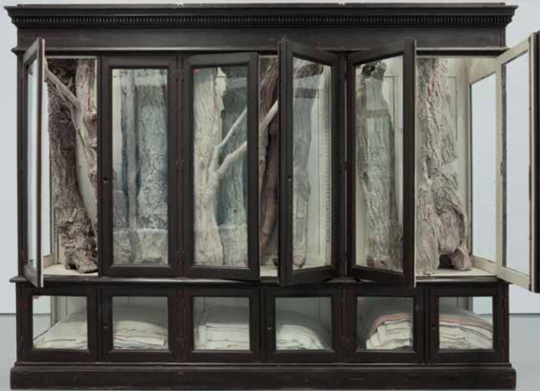
Berlinde De Bruyckere | 028, 2007 | Private collection Milan.