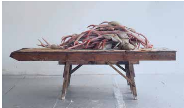
Berlinde De Bruyckere | Actaeon IV (Beijing), 2012 | Private Collection, London

"Sur la tête ruisselante d'Actéon, elle fait naître le bois d'un cerf vivace, allonge son cou, termine ses oreilles en pointe, change ses mains en pieds, ses bras en jambes effilées."