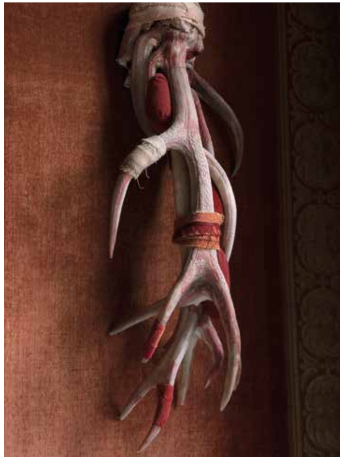
Berlinde De Bruyckere | Rodt, 6 Januari VIII, 2013