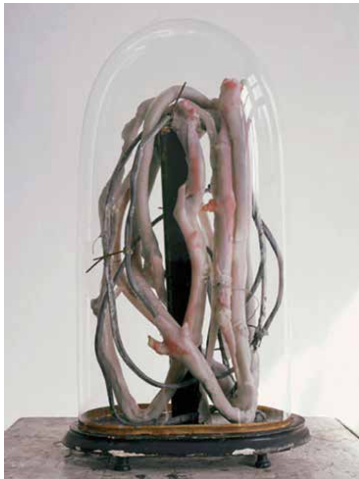
Berlinde De Bruyckere | Doornenkroon II, 2008 | THE EKARD COLLECTION