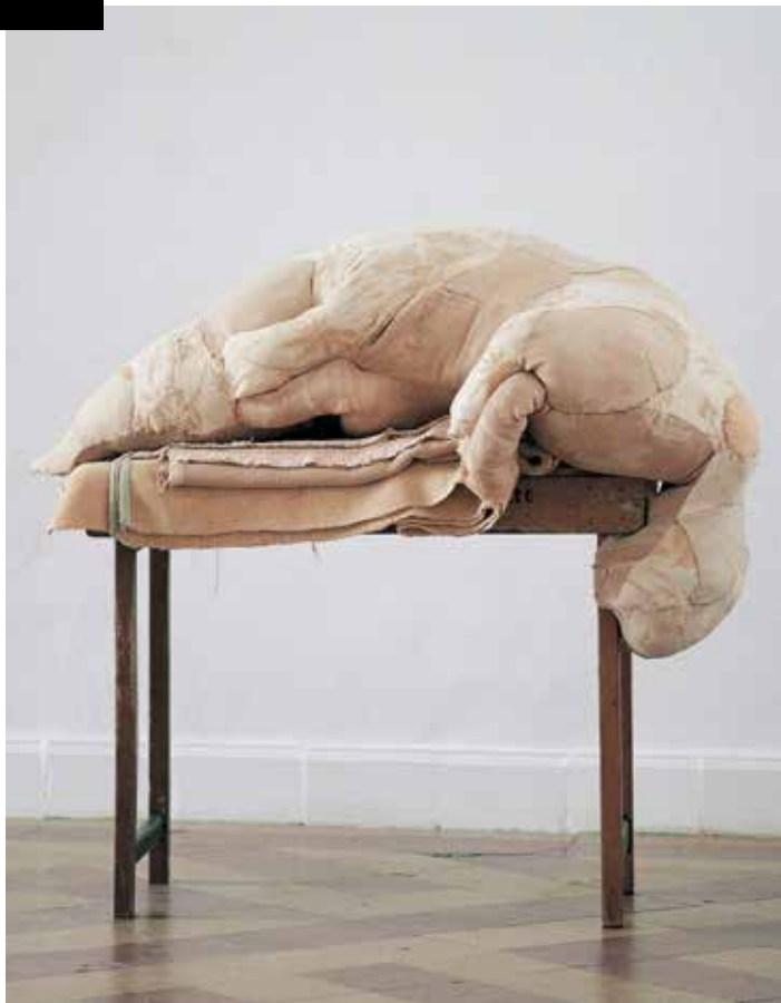
Berlinde De Bruyckere | Animal, 2002 | Private collection, London