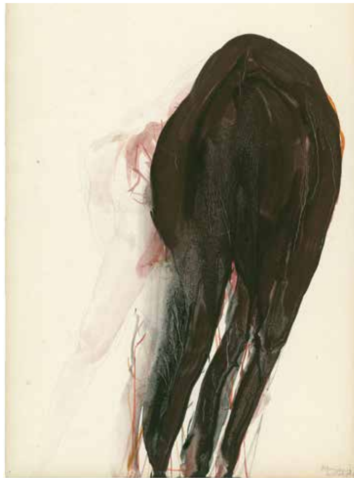
Berlinde De Bruyckere | Parasiet. 1997 | Courtesy the artist, Hauser & Wirth, Galleria Continua | © Mirjam Devriendt

Drawings are an essential part of this exhibition. They are hung in series in the same rooms as the sculptures, enriching them with their variations and nuances. Although De Bruyckere's three-dimensional work is better known than her drawings, the two disciplines go hand in hand in the development of her oeuvre. In her series of drawings, the artist above